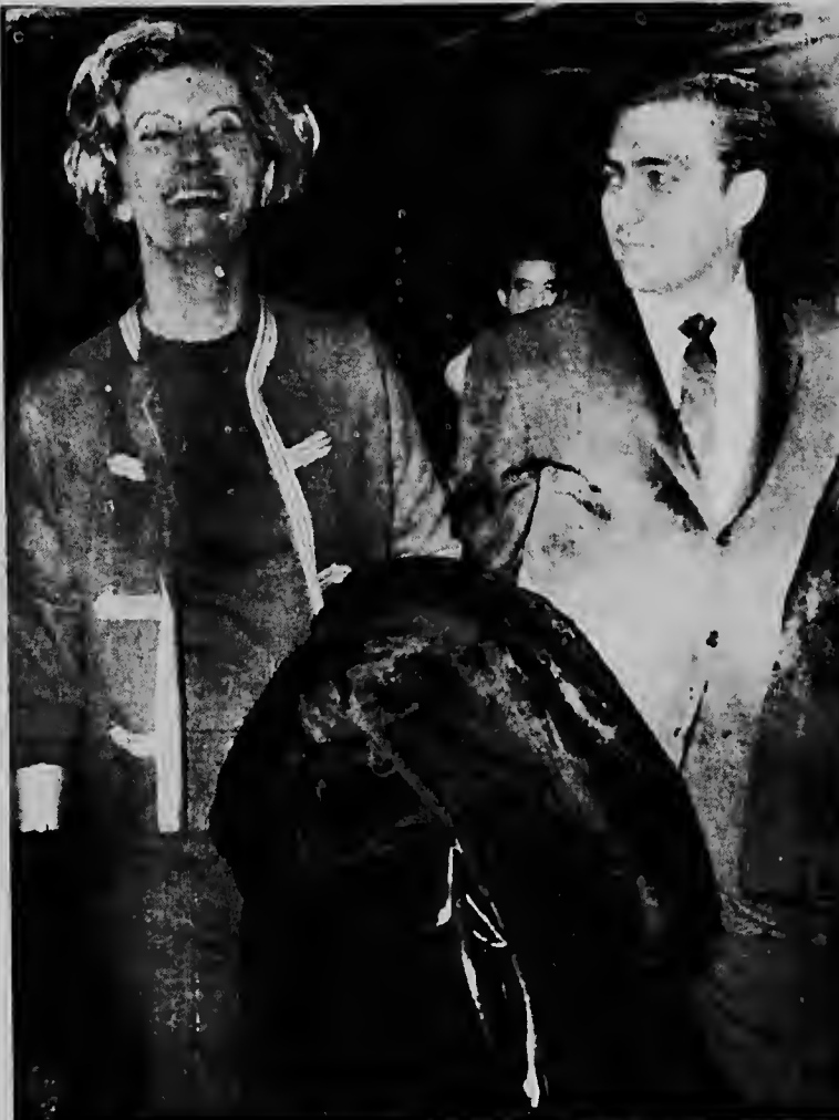
Acompaña pa su abogado e casi di senador Republicano Adam Clayton Powell a yega Miami procedente di Puerto Rico, en ruta pa Washington, caminda lo e presta declaracion dilanti di e comision cu ta investigando conducta di su casa. Senjora Powell a declara na periodistanan cu e ta sinti cuta su deber di presta declaracion y cu lo e papia berdad.